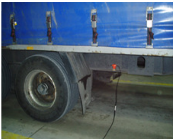
LKW mit Mess-Sensor

Im Justizvollzug wird der MDS seit 2005 in Deutschland und in der Schweiz eingesetzt.