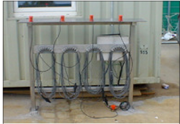
Sensor- und Kabelhalterung für fest installiertes System, z.B. in Torwache / Kfz-Schleuse