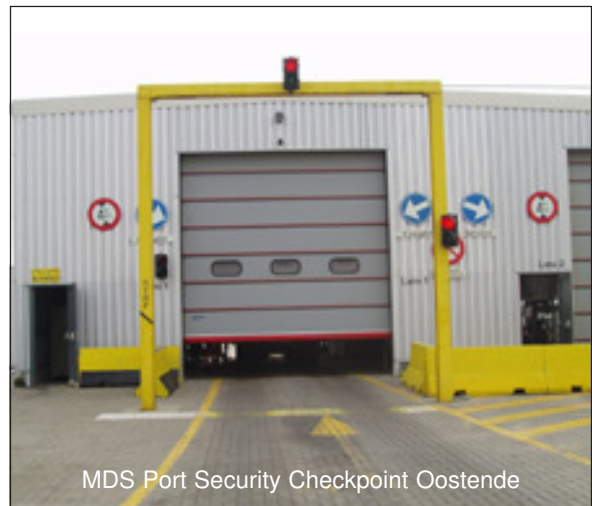
MDS Port Security Checkpoint Oostende

Die Software ist in der Lage, typische Schwingungen von untypischen Schwingungen zu unterscheiden. Normale Störungen, z.B. durch Setzung des Fahrwerks, durch Regen oder abtropfendes Regen- oder Schmelzwasser auf Fahrzeugteile werden automatisch weitgehend ausgefiltert.